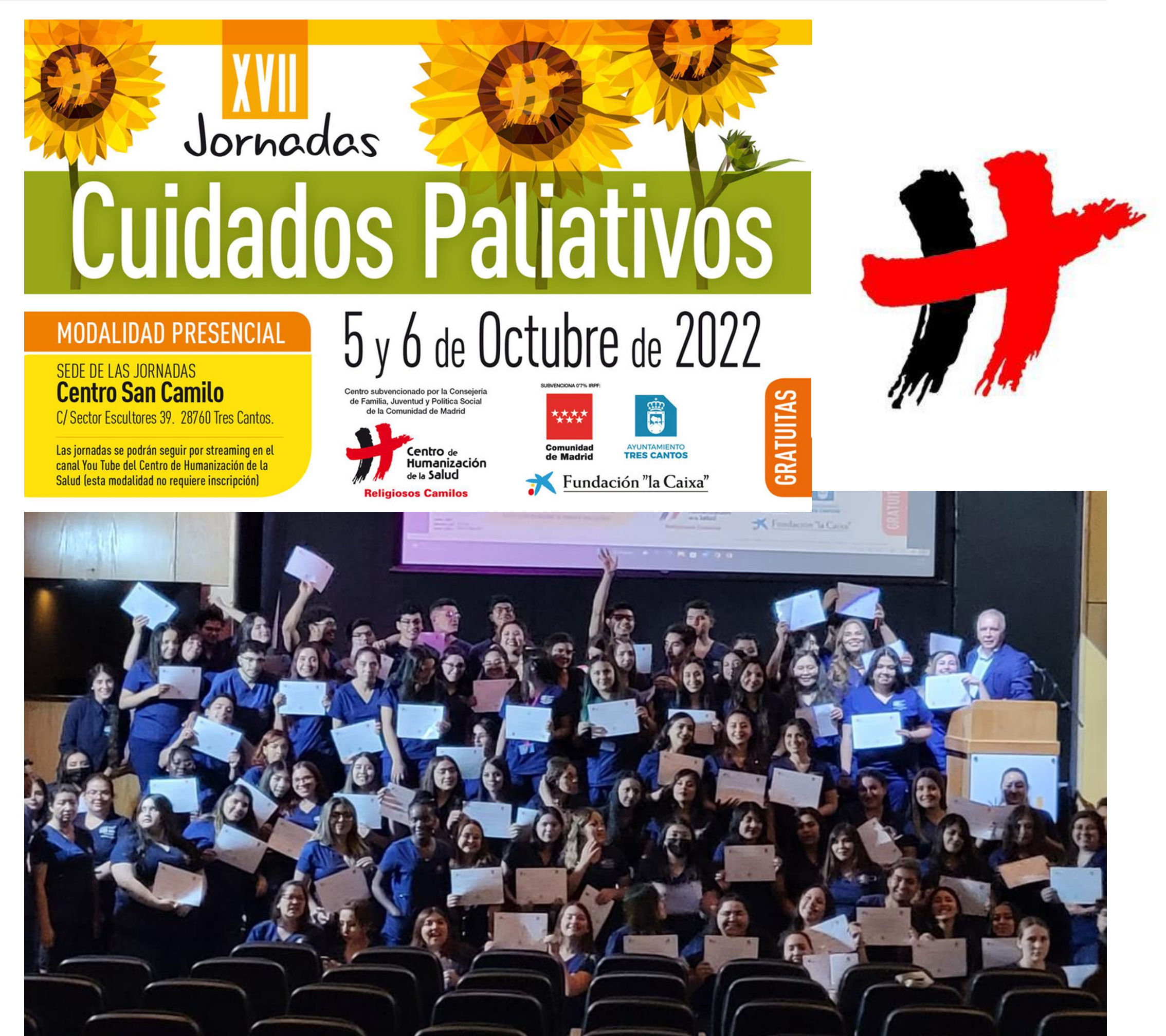
Imagen Corporativa de Centro de Humanización de la Salud (1). https://www.humanizar.es/fileadmin/media/imagenes/conocenos/imagen-corporativa/h-humanizar.jpg Imagen de autor